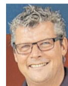
...und Norbert Dickel