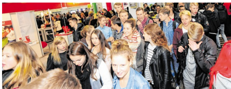
Die Organisatoren der Ausbildungsmesse hoffen wie im vergangenen Jahr erneut auf ein dichtes Gedränge im Busdepot in Ennepetal.

irren lässt, der wird irgendwann bei der Unterschrift unter seinen Aus-bildungsvertrag sagen können „Ich habe es mir sehr genau überlegt und dann spontan zugesagt.“ Oder - deutlich kürzer und x-mal gesehen und gehört: „Ich habe fertig“, „Aus. Aus. Aus. Das Spiel ist aus.“ AGr